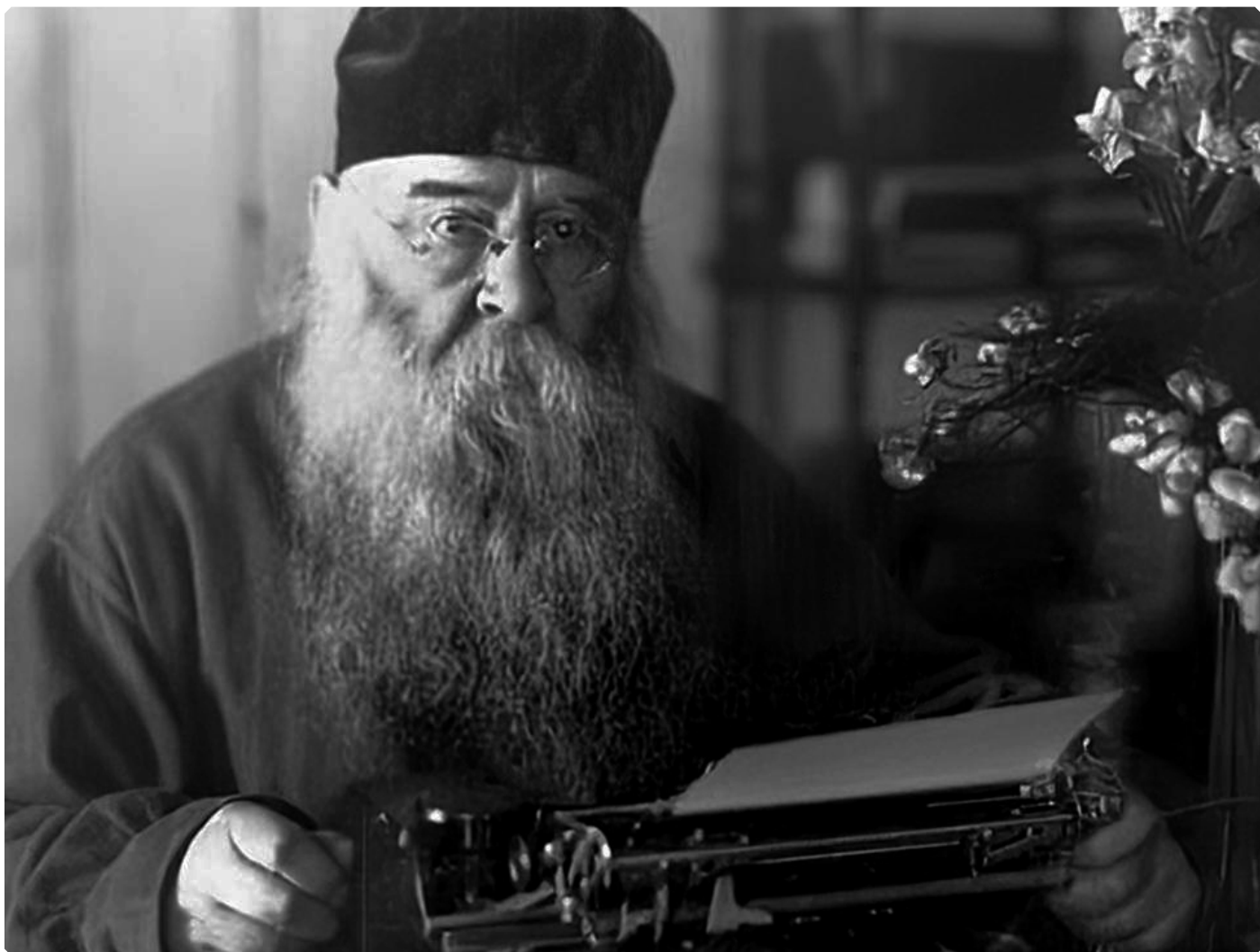
Митрополит Московский Сергей (Страгородский)

«Фашиствующие разбойники напали на нашу Родину. Попирая всякие договоры и обещания, они внезапно обрушились на нас, и вот кровь мирных граждан уже орошает родную землю. Повторяются времена Батые, немецких рыцарей, Карла шведского, Наполеона. Жалкие потомки врагов православного христианства хотят еще раз попытаться поставить народ наш на колени пред неправдой, голым насилием