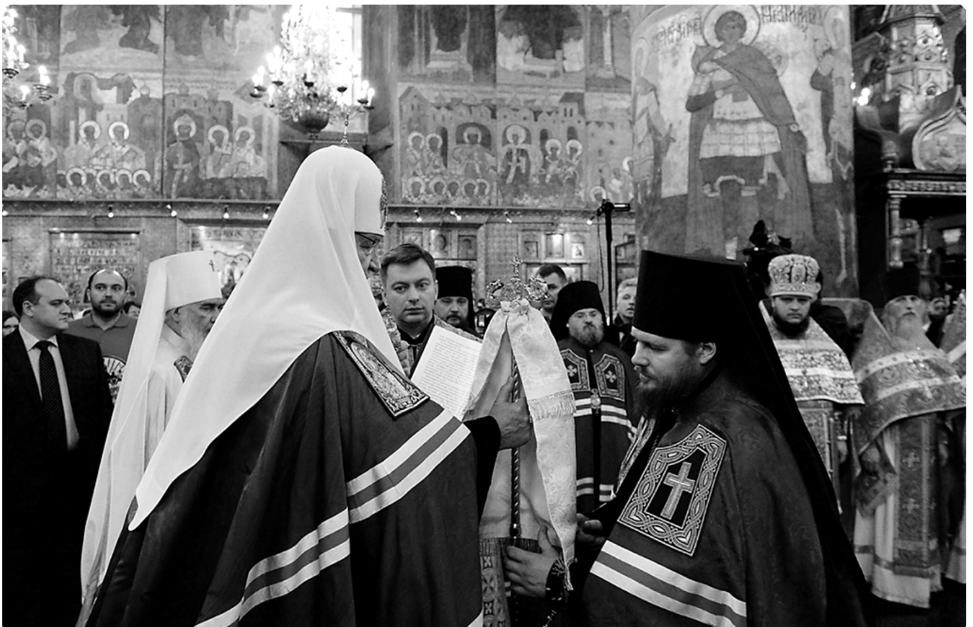
Вручение архиерейского жезла Преосвященнейшему Серафиму, епископу Тарусскому. Патриарший Успенский собор Московского Кремля. 4 декабря 2015 г.