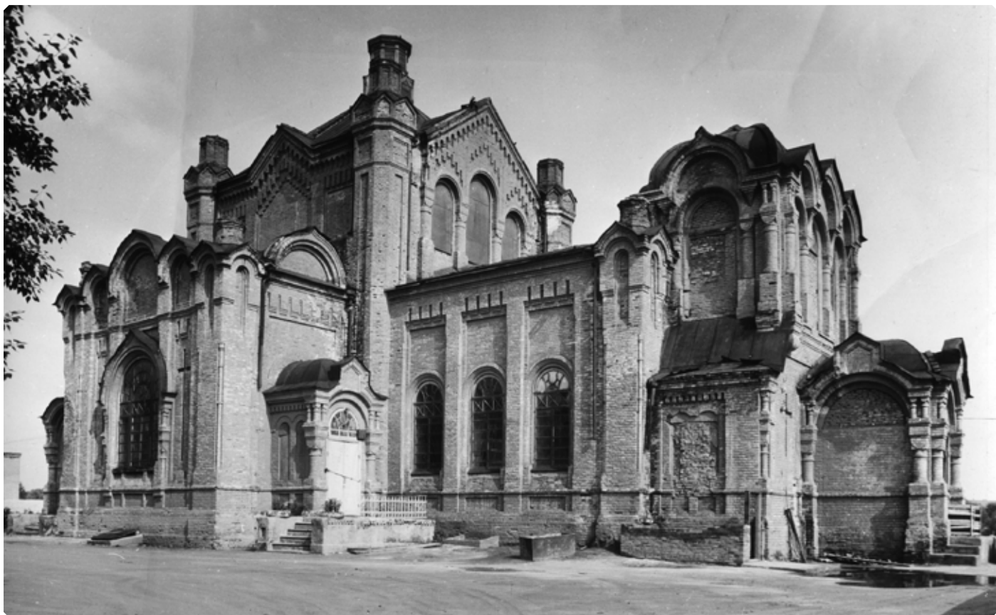
В Казанской церкви г. Бийска – склады воинской части. 1986 г.

народом; да и не удивительно, когда на весь город имеется только эта одна церковь».