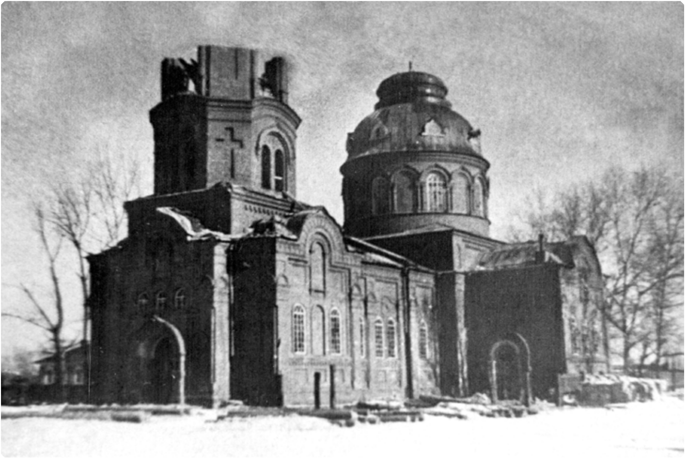
Снос колокольни Александро-Невской церкви г. Бийска. 1942 г.