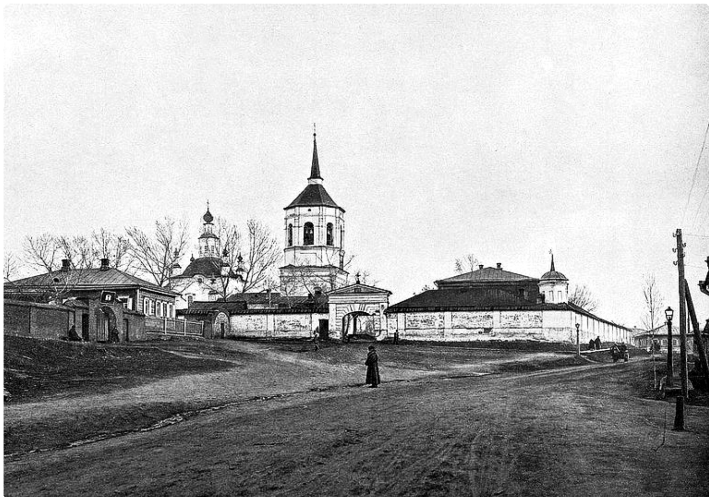
Томский Богородице-Алексеевский монастырь. Здесь с 1882 по 1899 гг. располагалась Томская духовная семинария. Фото 1903 года