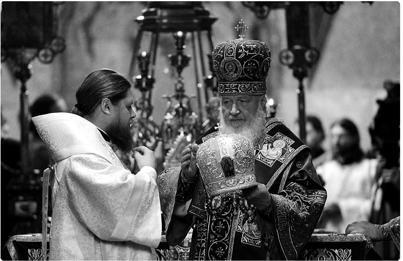
Святейший Патриарх Кирилл и епископ Тарусский Серафим. Патриарший Успенский собор Московского Кремля. 4 декабря 2015 г.