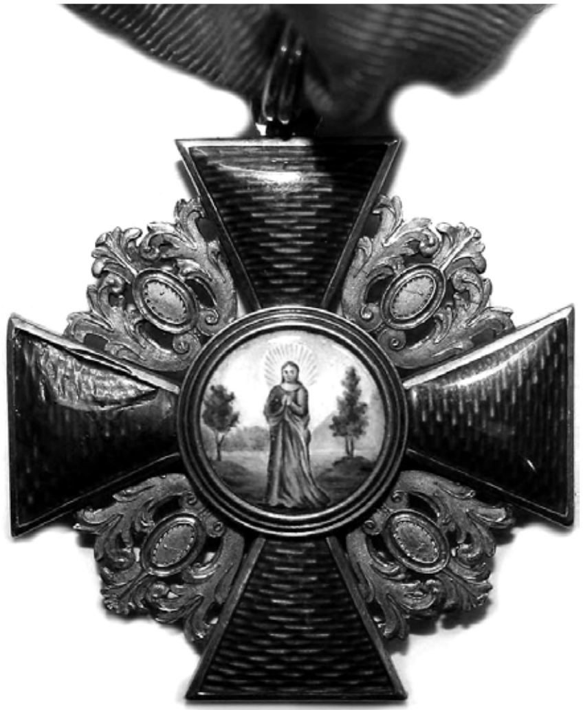
Императорский орден Святой Анны

ложен во диакона, а 16 ноября 1893 года Указом Консистории за № 8802 утвержден штатным диаконом той же церкви.