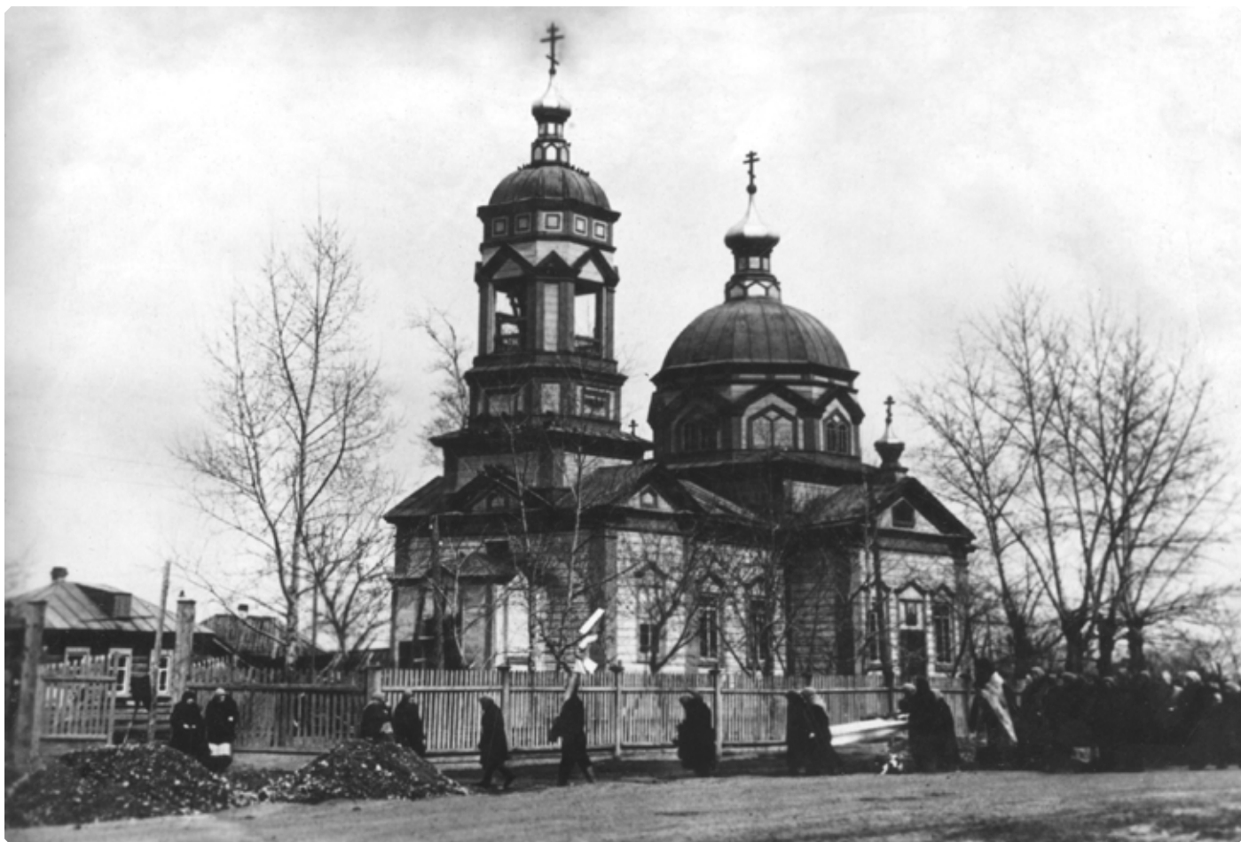
Зареченская Покровская церковь незадолго до сноса. 1961 г.

принудить его пожертвовать благом и целостью Родины, кровными заветами любви к своему Отечеству... Наши предки не падали духом и при худшем положении, потому что помнили не о личных опасностях и выгодах, а о священном своем долге пред Родиной и верой, и выходили победителями. Не посрамим же их славного имени и мы – православные, родные им по плоти и вере. Отечество защищается оружием и общим народным подвигом... Вспомним святых вождей русского народа, например, Александра Невского, Димитрия Донского, полагавших души свои за народ и Родину... Церковь Христова благословляет всех православных на защиту священных границ нашей Родины».