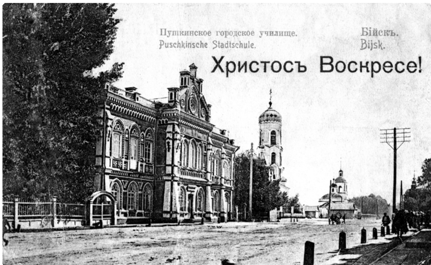
Успенская улица. Пушкинское городское училище с домовым Константино-Еленинским храмом, градо-Бийские Успенская церковь и Казачий Старо-Успенский собор (справа). 1910-е гг.

Люди посOLIDней ездят туда на линейках и смотрят на молодых людей. Простые люди