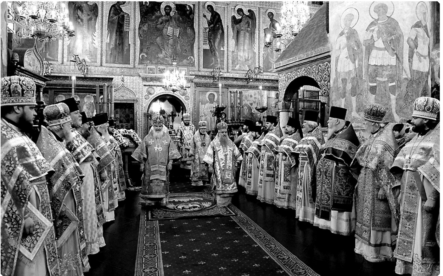
Духовенство Русской Православной Церкви на празднике Введения во храм Пресвятой Богородицы. Патриарший Успенский собор Московского Кремля. 4 декабря 2015 г.