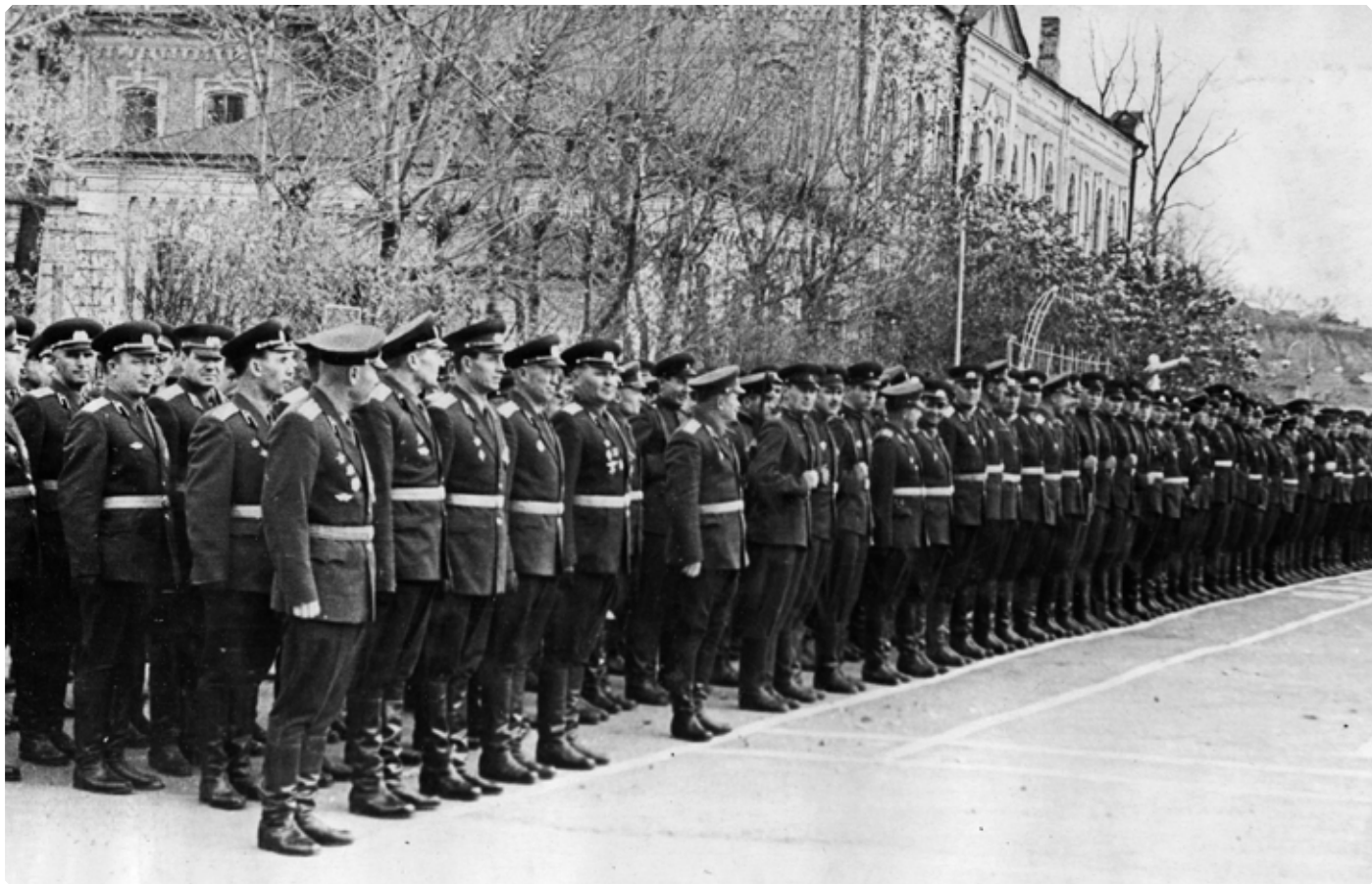
Офицеры воинской части на плацу перед Гарнизонным домом офицеров, располагавшемся в здании бывшего Бийского миссионерского катехизаторского училища. 1960-е гг.