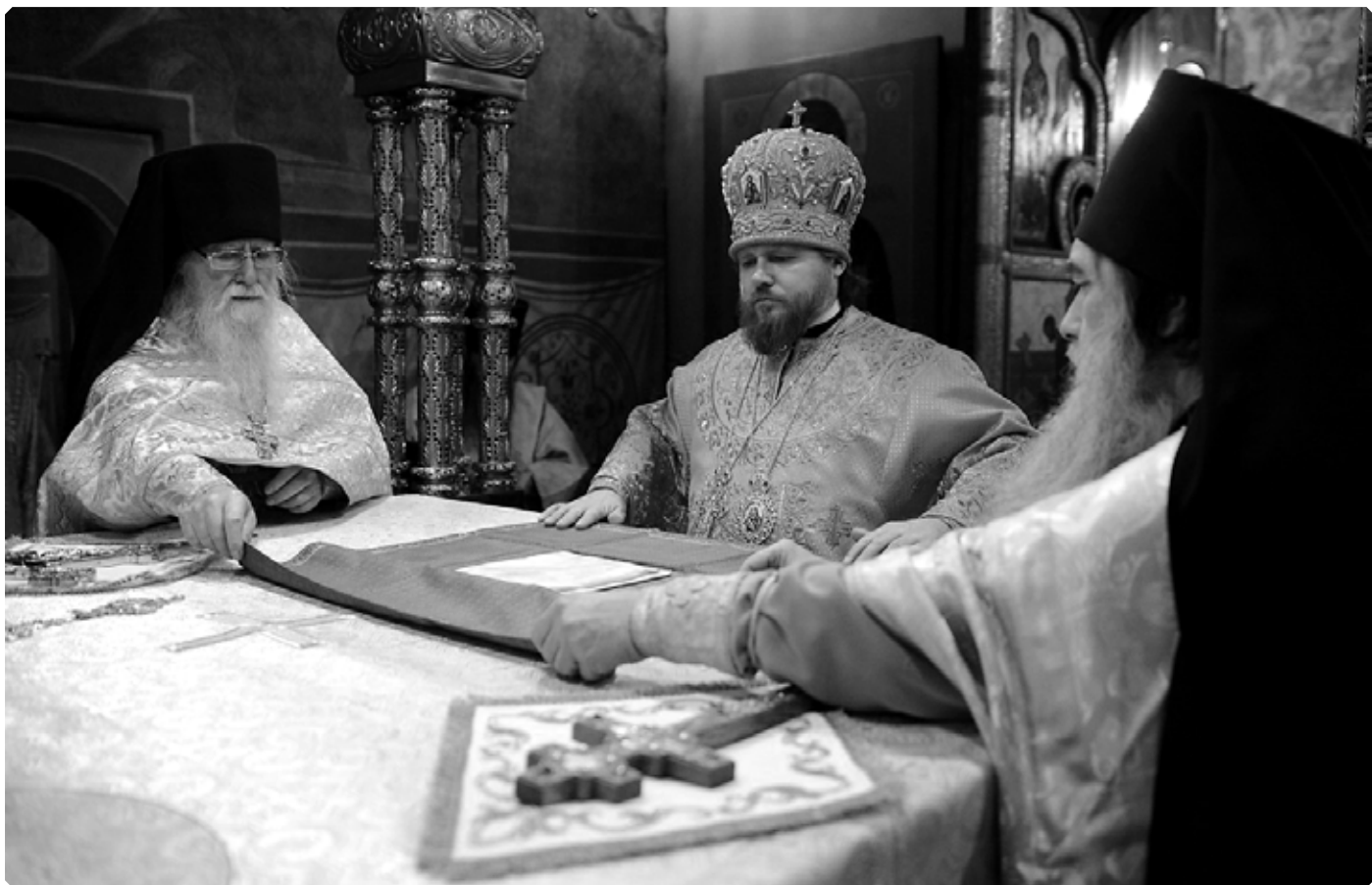
Епископ Тарусский Серафим. Архиерейское богослужение в Пафнютьевом монастыре. 27 января 2019 г.

– Владыка, за Вашими плечами двадцативосьмилетний опыт монашеской жизни, опыт преподавания, неоценимый семнадцатилетний опыт руководства Рождества Богородицы Свято-Пафнютьевым Боровским монастырем. 7 февраля 2020 года на епархиальном совете под Вашим руководством было принято решение о создании при бийском зареченском храме Покрова Божией Матери монашеской общины в честь преподобного Макария Алтайского. Начинается возрождение монашеской жизни в Бийской епархии?