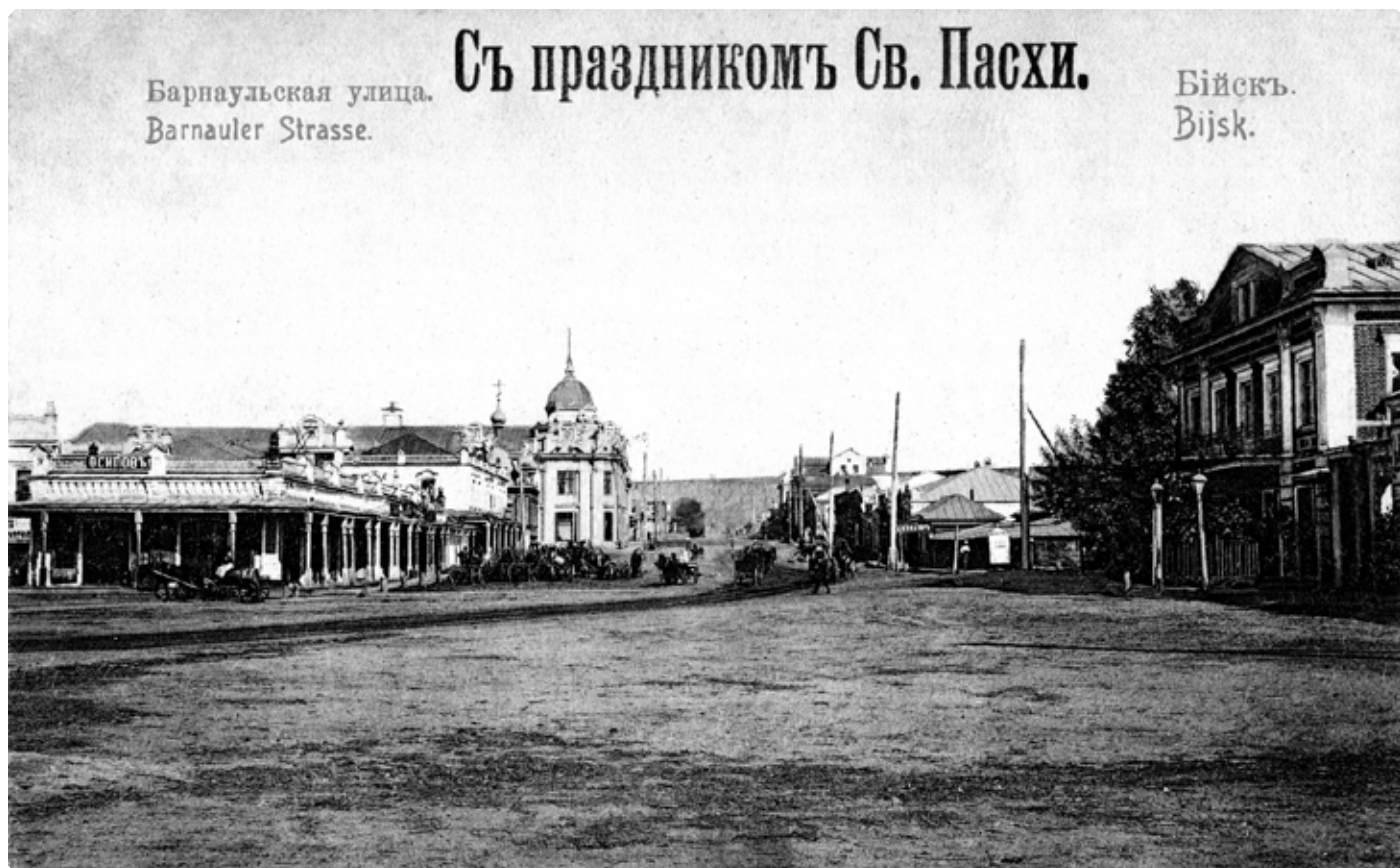
Барнаульская улица (ныне проспект имени С.М. Кирова). Слева – Иверская часовня. 1910-е гг. Почтовая карточка.