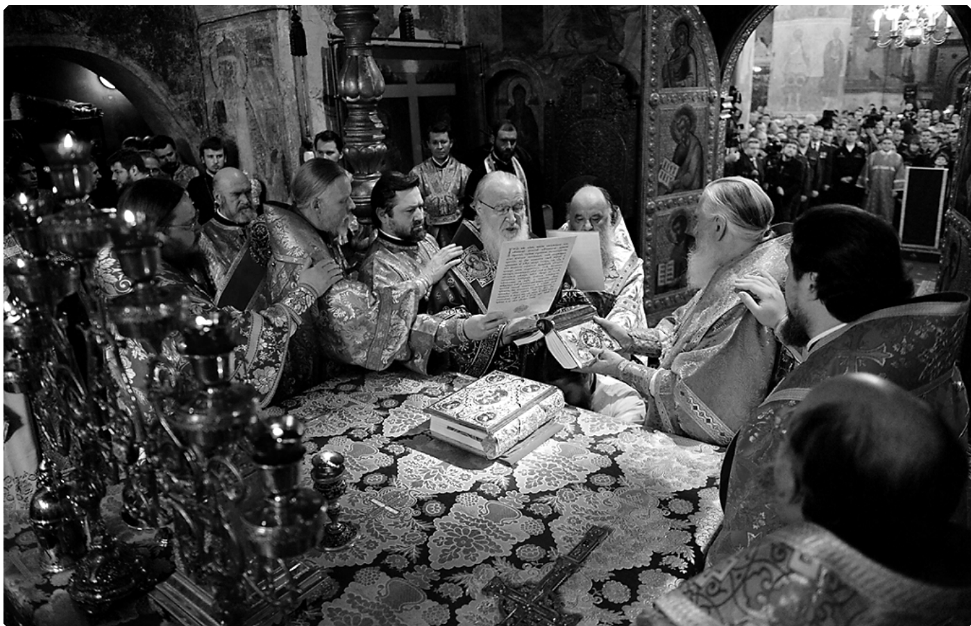
Хиротония архимандрита Серафима (Савостьянова) во епископа Тарусского, викария Калужской епархии. Патриарший Успенский собор Московского Кремля. 4 декабря 2015 г.

год моего пребывания в Калужской митрополии, был добавлен предмет, изучающий новейшие нормативные документы Русской Православной Церкви. В Барнаульской духовной семинарии на сегодняшний день я веду нравственное богословие и основы социальной концепции.