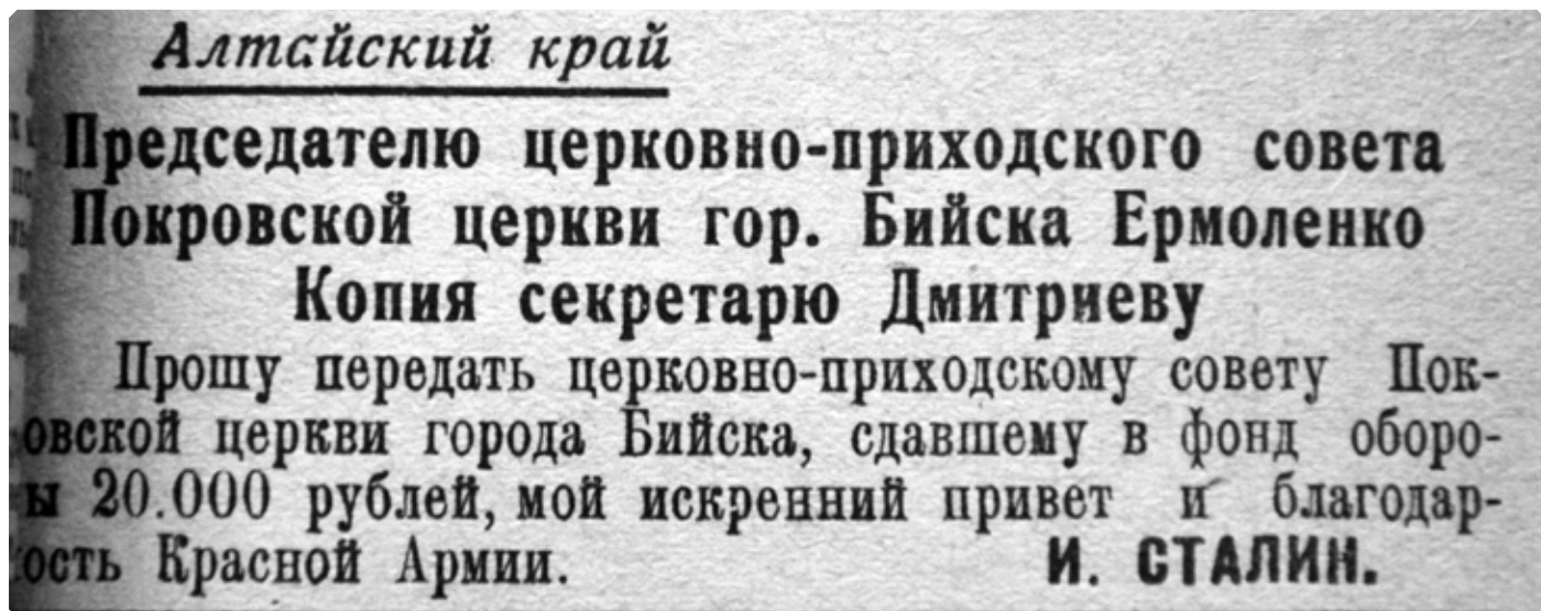
Заметка из газеты «Бийский рабочий» от 11 мая 1943 г.

писал: «Ко Всенощному бдению я пришел и увидел, что народ стоит стеною у церкви, а церковь была совершенно переполнена народом. Поют там монашки из закрытых монастырей, поют довольно прилично... На Литургии в праздник точно так же и церковь, и ограда были переполнены