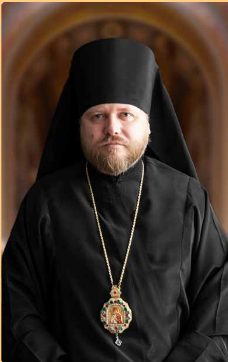
Епископ Бийский и Белокурихинский Серафим

К ее началу над Русской Православной Церковью нависла угроза полного уничтожения. В стране была объявлена «безбожная пятилетка», в ходе которой руководством советского государства была поставлена задача окончательного избавления от «религиозных пережитков». Почти все оставшиеся в живых архиереи находились в лагерях, а количество действующих храмов на всю страну не превышало нескольких сотен. Несмотря на это в пер-