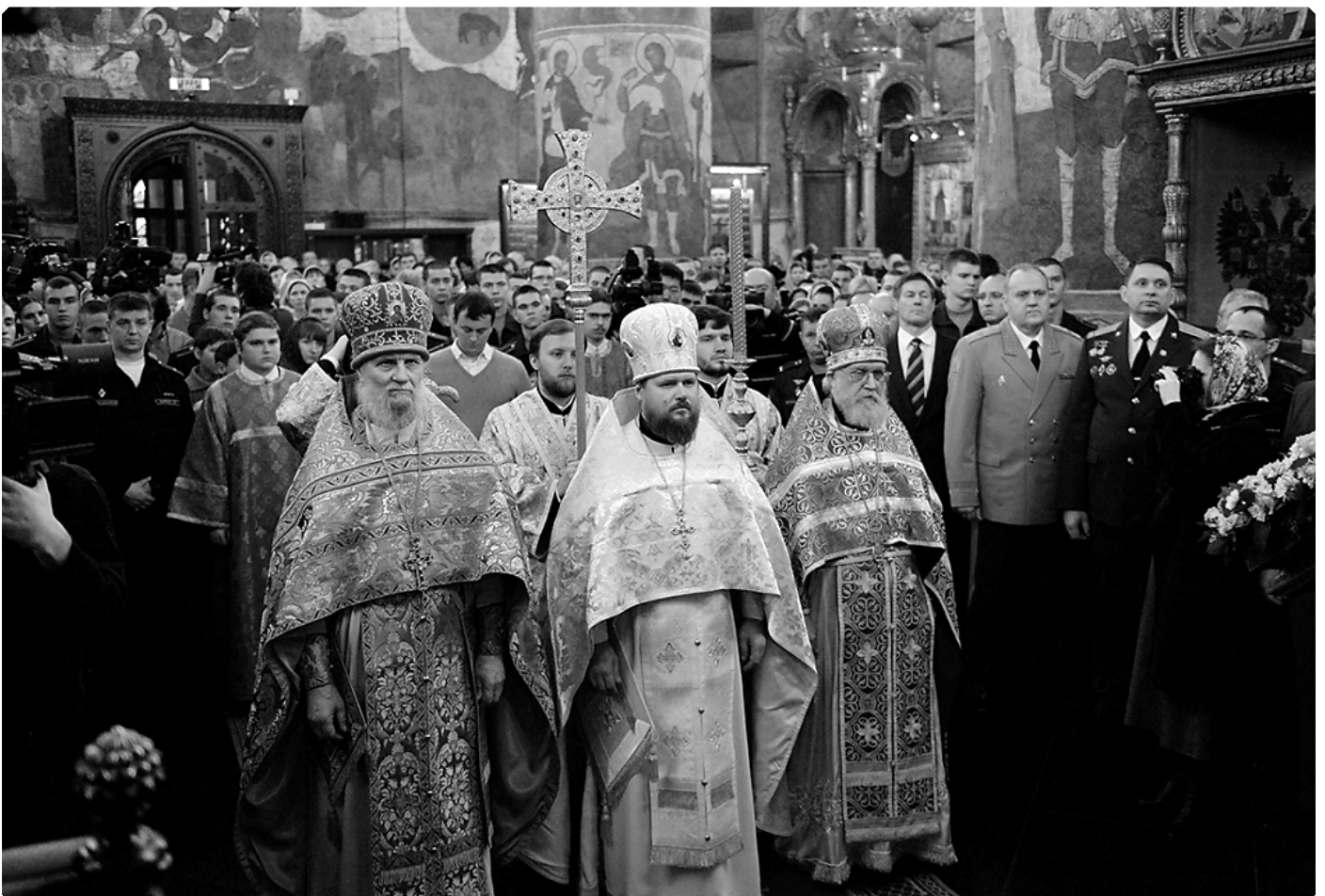
Хиротония архимандрита Серафима (Савостьянова) во епископа Тарусского, викария Калужской епархии. Патриарший Успенский собор Московского Кремля. 4 декабря 2015 г.