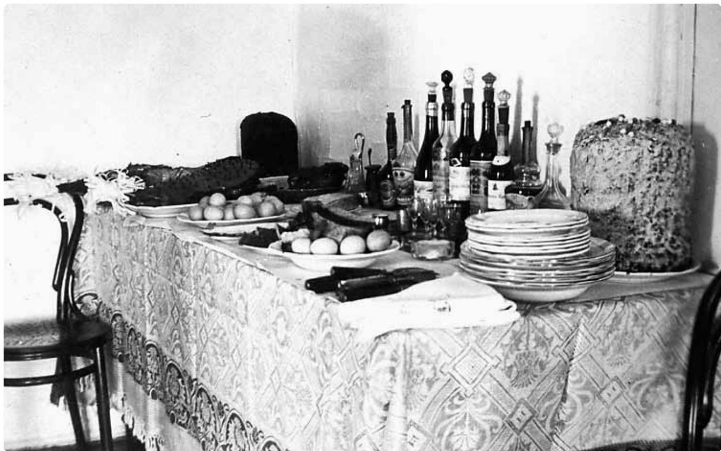
Пасхальный стол в семье бийских учителей Сухаревых. 1903 г.

пешком взбираются на гору и дивятся на дам, едущих верхом на лошадях в мужских костюмах».